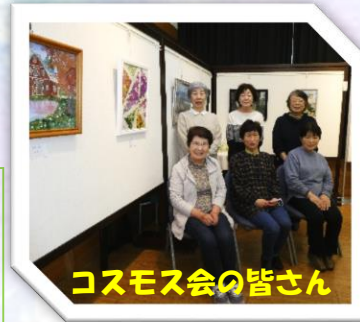
コスモス会の皆さん